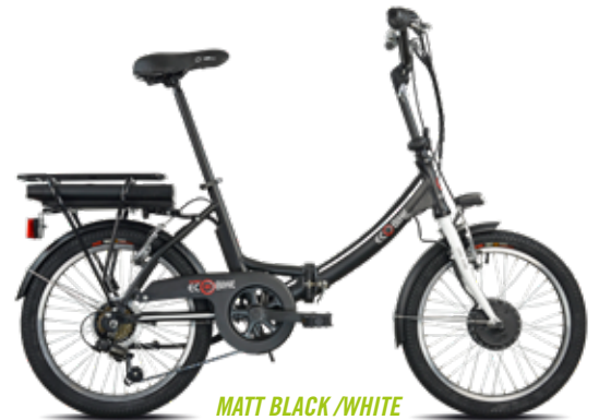
MATT BLACK /WHITE